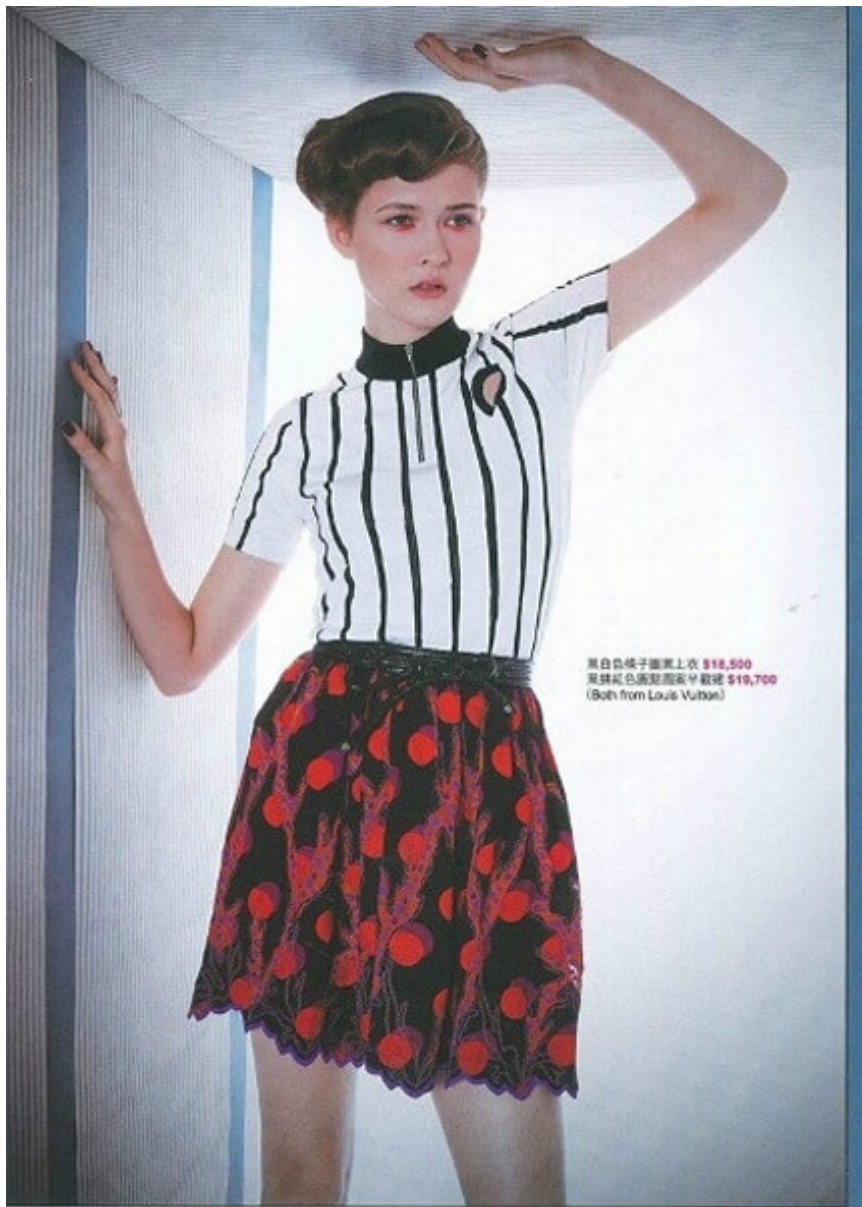
黑白條子圖案上衣 $18,500 黑拼紅色圓點圖案半截裙 $19,700 (Both from Louis Vuitton)