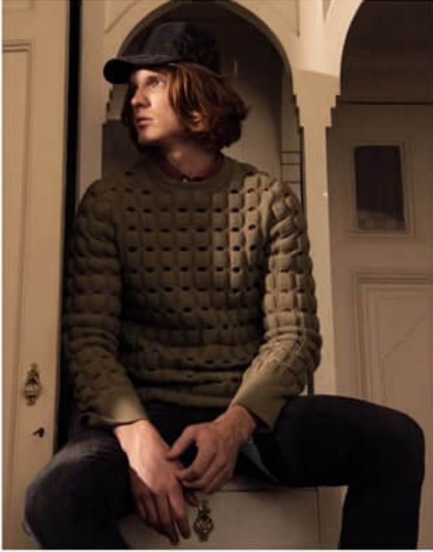
trika OOS 550 TL, gömlek PEOPLE BY FABRİKA 6990 TL, pantolon LEVİS (fiyat listede gösterilmemiştir), sağka ERMENEGİLO ZEDNA 2290 TL