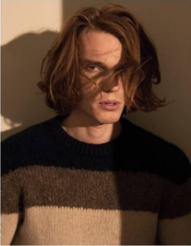
MONCLER 3.000 TL