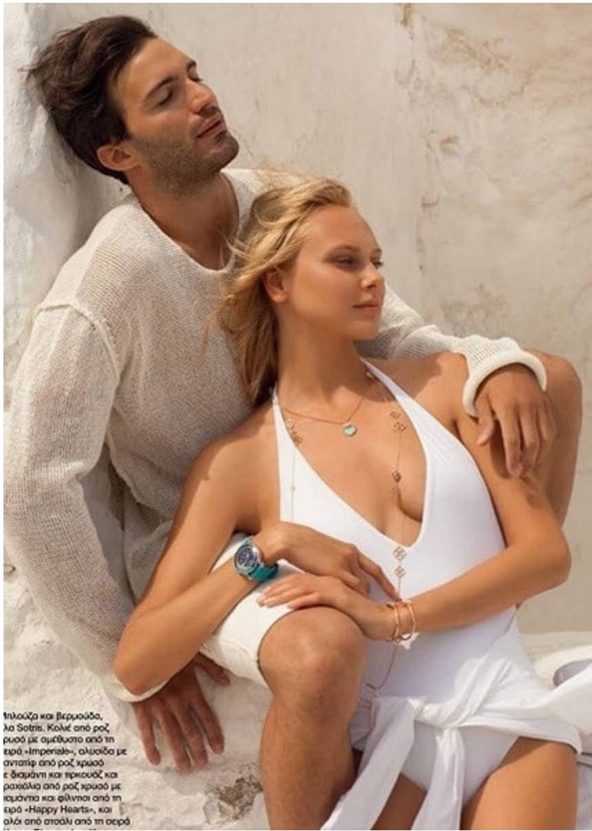
Υψηλόχα και βερμούδα, λα Satris. Κολιέ από ροζ χρυσό με αμέθυστο από τη σειρά «Impetiale», αλυσίδα με αντατίφ από ροζ χρυσό ε διαμάντι και περκουάζ και ρακέλια από ροζ χρυσό με ισιάντια και φίλντις από τη σειρά «Happy Hearts», και αλχι από στούλι από τη σειρά