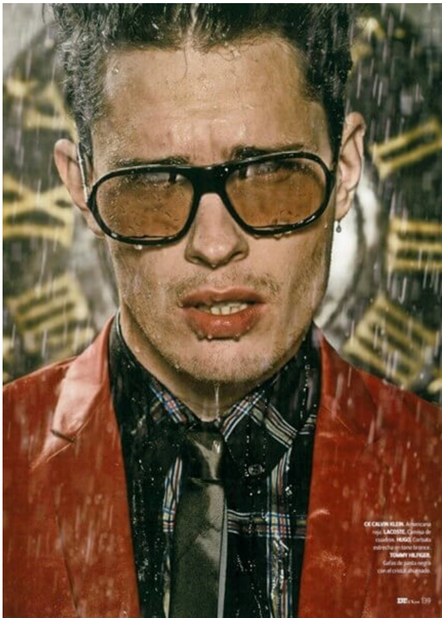
CELEBRITY FASH Americano nato LACOSTE . Giacca di cuoio HERO . Costume estivo di lana bruno. TOMMY HILF Cuffia di panna secca con etichetta sbiadita.